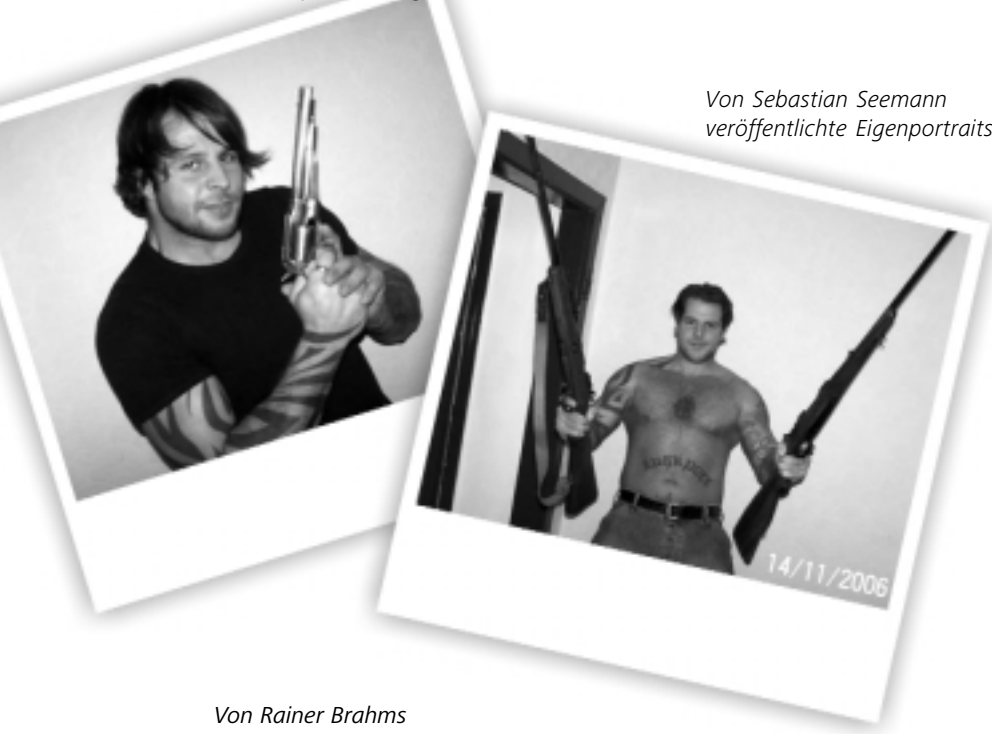
Von Sebastian Seemann veröffentlichte Eigenportraits