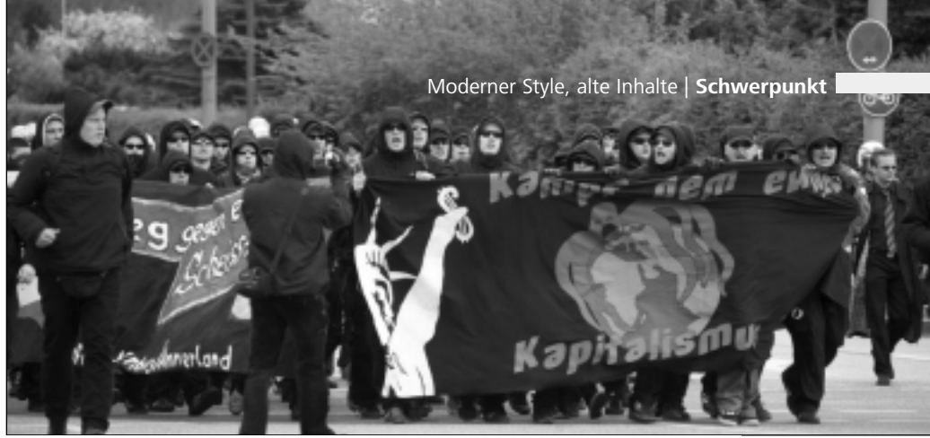
„Kampf dem ewigen Kapitalismus“: Aus dem NS bekannte Feindbilder...

hätten im kapitalistischen Alltag an Schärfe verloren: „Das Kapital kassiert, das Volk blutet!“ Der „nationale und sozialistische Widerstand“ stehe für einen „konsequenten Angriff auf die Interessen des Kapitals“. Statt einer umfassenden Kapitalismuskritik liefert die vermeintliche „Analyse“ jedoch nur die aus dem historischen NS hinlänglich bekannten Feindbilder. Neben einer antisemitisch und rassistisch aufgeladenen Agitation gegen den Kapitalismus haben gerade die NRW-Kameraden sich dem Kampf gegen Israel und die USA verschrieben. Dortmunder AN-Strukturen versuchen seit 2005, den Antikriegstag mit einem gegen Israel und die USA gerichteten Aufmarsch als festen Termin im Aktionskalender der Neonaziszene zu verankern.