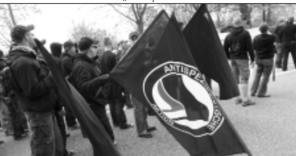
Auch Tierrecht ist Thema: Neonazi mit „Antispeziesistische Aktion“-Fahne

spricht: sich Auseinandersetzungen mit der Polizei liefern und gegen politische Gegner vorgehen.